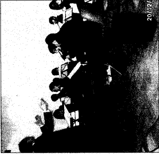
Un momento del concerto all'Auditorium

Infatti, oltre alla mostra di presepi allestita nei locali dell'Auditorium, il calendario Melody prevede un altro appuntamento musicale di forte coinvolgimento. Dopo il successo del noto fisarmonicista veggino maestro Adolfo Zagari che si è esibito ieri sera, lunedì 29 dicembre il concerto del Coro Polifonico Interparrocchiale "Pranternitas" di Vibo Valentia regalerà alla collettività filadelfiese nuove emozioni. Ad aprire "i Concerti di Natale 2008" il direttore artistico, il maestro Tommaso Costati, il quale ha rivisto per un'ultima volta il teatro di Vibo Valentia e